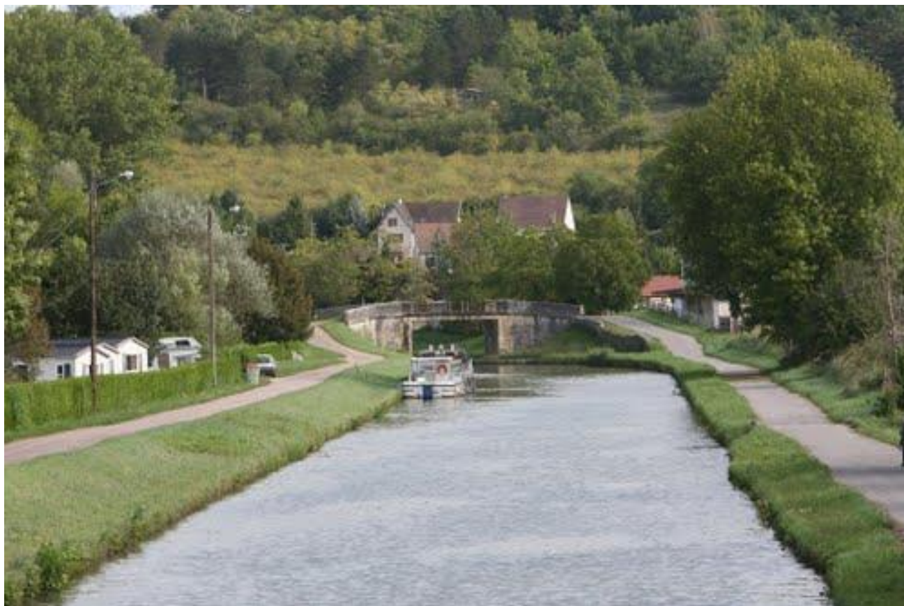
Vue de la gare et du camping de Châtel-Censoir